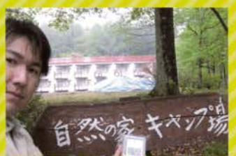
● 市内500カ所で放射能を測定し、公表!