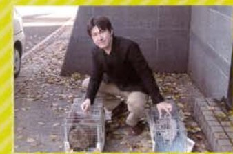
● 捨て猫の保護活動に取り組んでいます!