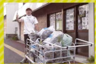
● 地域の方々とゴミ拾い隊を結成!