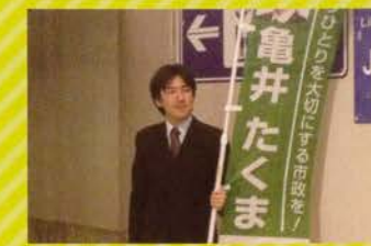
● 定期的に駅に立ち、御意見を伺っています!