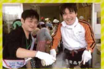
● 地域行事・学校行事でも全力!